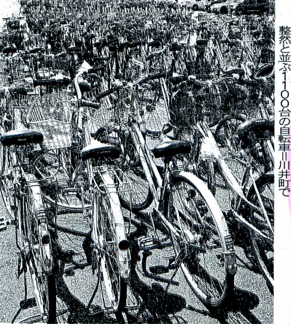
整然と並ぶ1100台の自転車川井町で

会館で開かれた同校の文化祭に訪れた際に駐車場を利用した。市民文化会館によると、使用許可した台数は